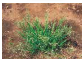
スズメノカタビラ